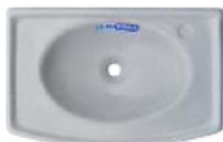
LAVATÓRIO MARIA CLARA

Tamanhos: 0,64 X 0,45 Direito e Esquerdo