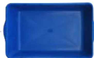
MASSEIRA DE FIBRA